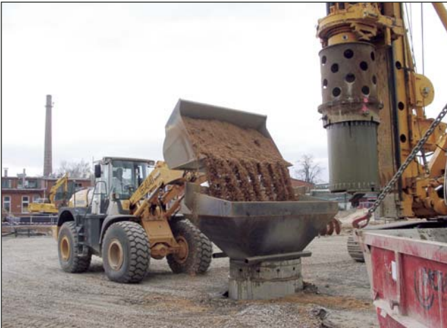
Die Bohrungen wurden nach vollständigem Aushub des kontaminierten Bodens aus der wassergesättigten Zone bei gleichzeitigem Ziehen der Verrohrung mit unbelastetem Material wieder verfüllt.

Am Standort Hanau wurde über mehr als 40 Jahre eine Produktions- und Forschungsstätte für atomare Brennelemente durch die NUKEM Hanau GmbH betrieben. Nach dem Beschluss zur Stilllegung und Beseitigung der Anlage im Jahr 1988 wurde im Oktober 2000 die Genehmigung zum Rückbau erteilt. Im Verlauf der langjährigeren Nutzung des Standortes kam es zu radioaktiven Verunreinigungen des Untergrunds, teilweise auch in der gesättigten Zone. Eine Bodensanierung auf dem Gelände wurde dadurch notwendig.