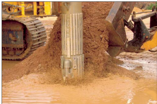
Die Anforderungen an die Verdichtung waren aufgrund der Folgenutzung sehr hoch. Deshalb wurde eine zusätzliche Nachverdichtung der ausgetauschten Bodenbereiche mit der Rütteldruckverdichtung BAUER RG22/TR17 durchgeführt.

Aufgrund der radioaktiven Belastung mussten zusätzliche Arbeitsschutzmaßnahmen ergriffen werden. Von BMU wurde hierzu auch der eigene Strahlenschutzbeauftragte der BAUER Umweltgruppe eingesetzt. Das Personal wurde einer Strahlenschutzuntersuchung unterzogen und während der Arbeiten kontinuierlich mittels Dosimetern überwacht. Vor Verlassen des Geländes wurde durch die Ausschleusung des Personals über einen speziellen Hand-Fuß-Kontroll-Monitor eine Verschleppung der Kontamination ausgeschlossen.