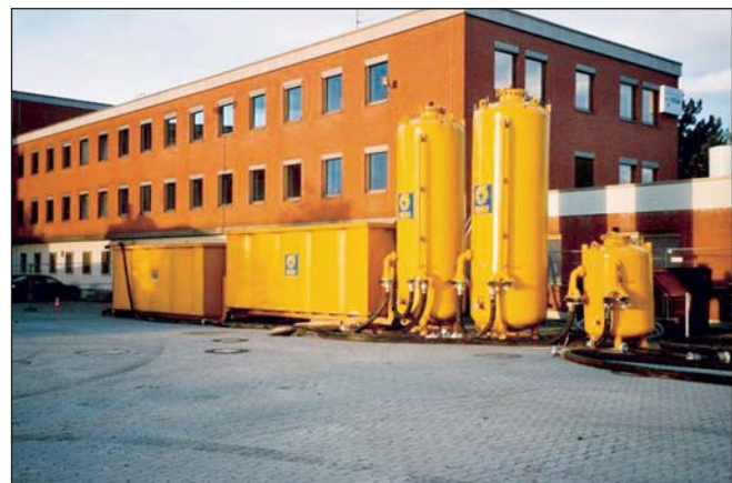
Die Grundwasserreinigung besteht aus zwei vorgelagerten Absetzbecken, Sandfilter, Aktivkohlefilter und einer Cyanidreinigungsstufe.

Das kontaminierte Material wird mit einem wasserdicht verschleißbaren Kastenbohrer aus dem Untergrund geborgen. Über ein Schüttrohr wird eine Zementsuspension mit Kies zur Wiederverfütterung eingebracht.