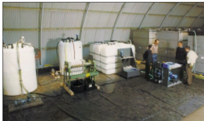
BIOLEA-Pilotanlage zum Sediment-Bioleaching im Bodenreinigungszentrum Hirschfeld (Bauer und Mourik Umwelttechnik GmbH & Co.)

Das Projekt wurde von der Deutschen Bundesstiftung Umwelt (DBU) gefördert.