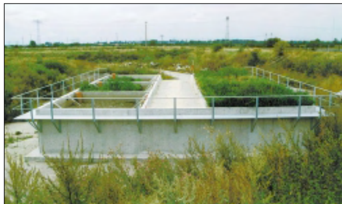
Versuchsanlage SECON zur Sediment-Konditionierung an der Weißen Elster (Kleindalzig bei Leipzig)