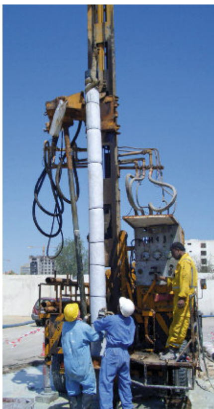
▲ Im Rahmen der Erkundung der Benzin-Kontamination in Doha wurden acht Grundwassermessstellen eingerichtet.

Bei Aushubarbeiten für ein neues Gebäude in Doha, Katar, stellte der Supreme Council for the Environment and Natural Reserves (SCENR) eine starke Verunreinigung mit Benzin fest, die auf eine nahe gelegene Tankstelle zurückzuführen war. Die Institution beauftragte die BAUER Umweltgruppe mit der Erkundung und Sanierung der Kontamination. Es wurden acht Grundwassermessstellen gebohrt und eingerichtet, Boden- und Grundwasserproben genommen