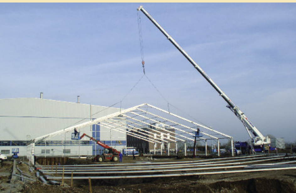
Auf dem Gelände der ehemaligen Weichmacherproduktion für die Kunststoffindustrie führte BAUER Umweltgruppe eine Quellensanierung durch. Zum Schutz vor Emissionen erfolgte der Bodenaustausch innerhalb einer Einhausung.

Zum Schutz vor Emissionen erfolgte der Aushub von 53.000 m 3 kontaminierten Bodens unter einer 90 x 40 m großen Zelthalle. Eine zweite, 60 x 40 m große Zelthalle mit asphaltiertem Boden und Abwasserableitung diente als Bereitstellungslager zur Separierung des Bodenmaterials. Zur Absaugung und Behandlung der schadstoffangereicherten und explosionsgefährdeten Atmosphäre in den Hallen waren eine leistungsstarke Bewetterungsanlage sowie eine Abluftreinigungsanlage mit einem Durchsatz von 90.000 m 3 /h erforderlich.