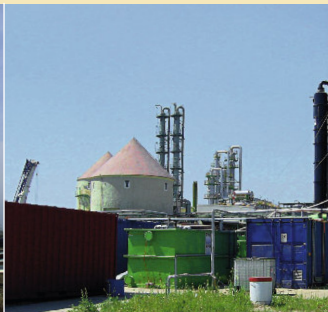
Gemeinsam mit Bauer Spezialtiefbau übernahm BAUER Umweltgruppe die Abstomsicherung an der Alten Raffinerie.