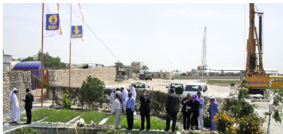
▲ Die PURE-Pflanzenkläranlage auf dem Gelände der BAUER Niederlassung in Doha liefert Bewässerungswasser und trägt so zur Lebensqualität in der ariden Umgebung bei. Vom zuverlässigen und einfachen Betrieb der Anlage überzeugten sich zahlreiche Gäste im März 2007 persönlich.

und analysiert, sowie ein Pumpversuch durchgeführt, um die Eigenschaften des Grundwasserleiters zu bestimmen.