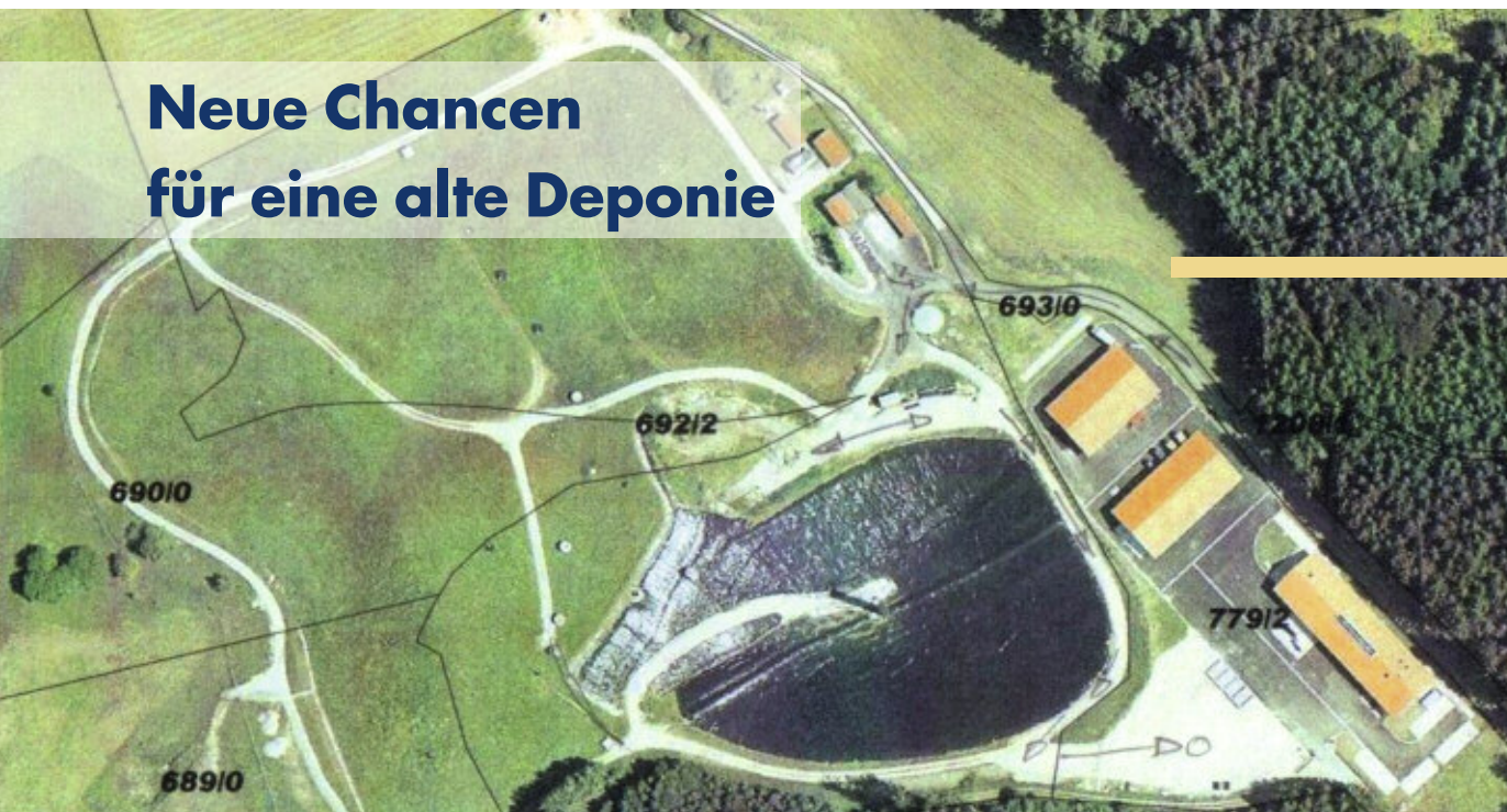
FIS Naturschutz, Bayr. Landesvermessungsamt