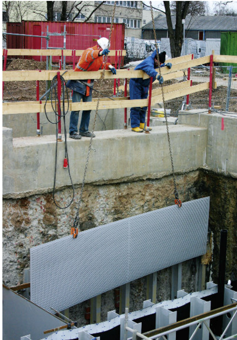
Das Funnel-Bauwerk wurde als 550 mm dicke Dichtwand im Mixed-in-Place-Verfahren (MIP) ausgeführt. Im Bild das Einheben der Metallsiebe.

werden durch Zugabe von Wasserstoffperoxid ( H_2O_2 ) die Eisenverbindungen im Schrägklärer ausgefällt, die andernfalls die Bioreaktoren zusetzen könnten. Anschließend durchströmt das Wasser die insgesamt drei Biofilter. Dabei werden wiederholt H_2O_2 , Natriumnitrat und Natriumphosphat zudosiert, um den mikrobiologischen Schadstoffabbau zu fördern. Nach rund drei Tagen Verweilzeit im Bioreaktor passiert das Wasser abschließend einen Aktivkohlefilter, der etwaige noch vorhandene schwer biologisch abbaubare organische Verbindungen adsorbiert, bevor das gereinigte Wasser wieder in den Untergrund abgegeben wird.